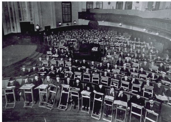
Ешива Мир в Шанхае

Эти понятия — основы учения о нравственности. Счастлив тот, кто размышляет об этом и прочувствовал сердцем эти важнейшие основы Торы.