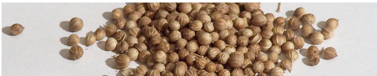
Зерна Кориандра. «(Ман) как зерна кориандра белого» Книга Шмот 16:31

Читаем дальше: «Сказал им Моше: Не оставляйте от него (от собранного мана) до утра. Но не послушались Моше... и завелись в мане черви, и прогнил он». Раби Ерухам комментирует: «Не только о мане, что выпадал в пустыне, говорится здесь. Люди заботятся о будущем, они хотят быть уверенными, что завтра не останутся нищими. По крохам собирают, отрывая от себя, экономя на самом необходимом, бьются, стараются. Но наступает завтра — и выясняется, что от собранного ничего не осталось.